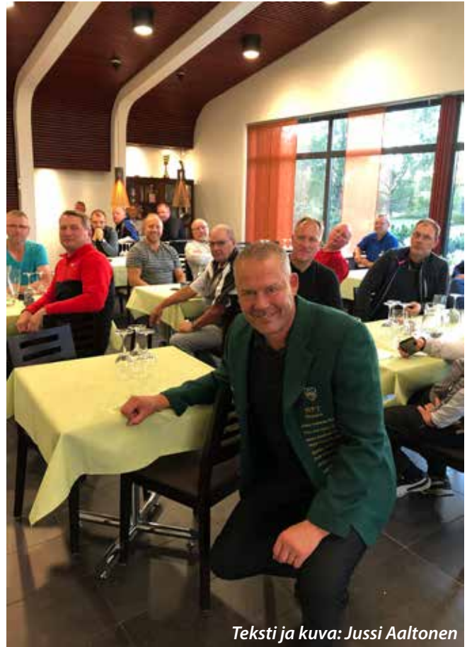
Teksti ja kuva: Jussi Aaltonen

Kiitoksia kaikille osallistujille hienosta kesästä, joka osakilpailussa oli yli 40 osallistujaa ja yhteensä kiertueella pelasi 82 eri pelaajaa.