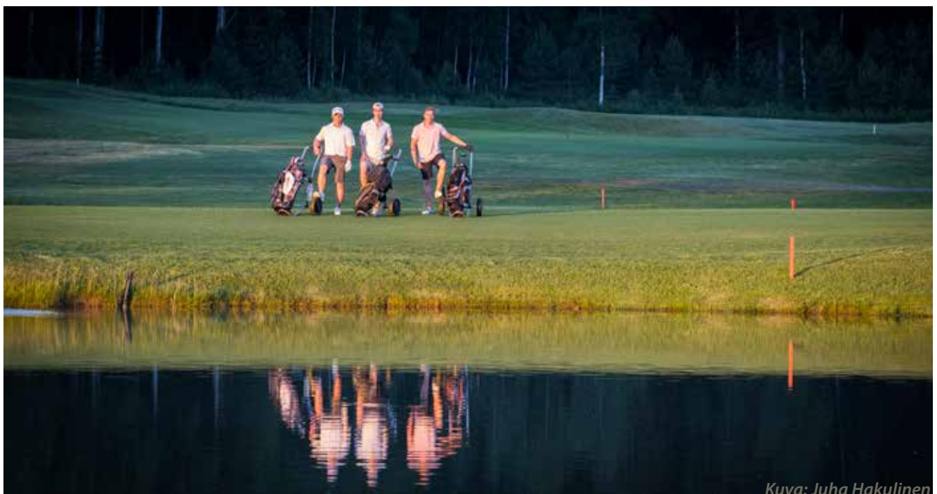
Kuva: Juha Hakulinen